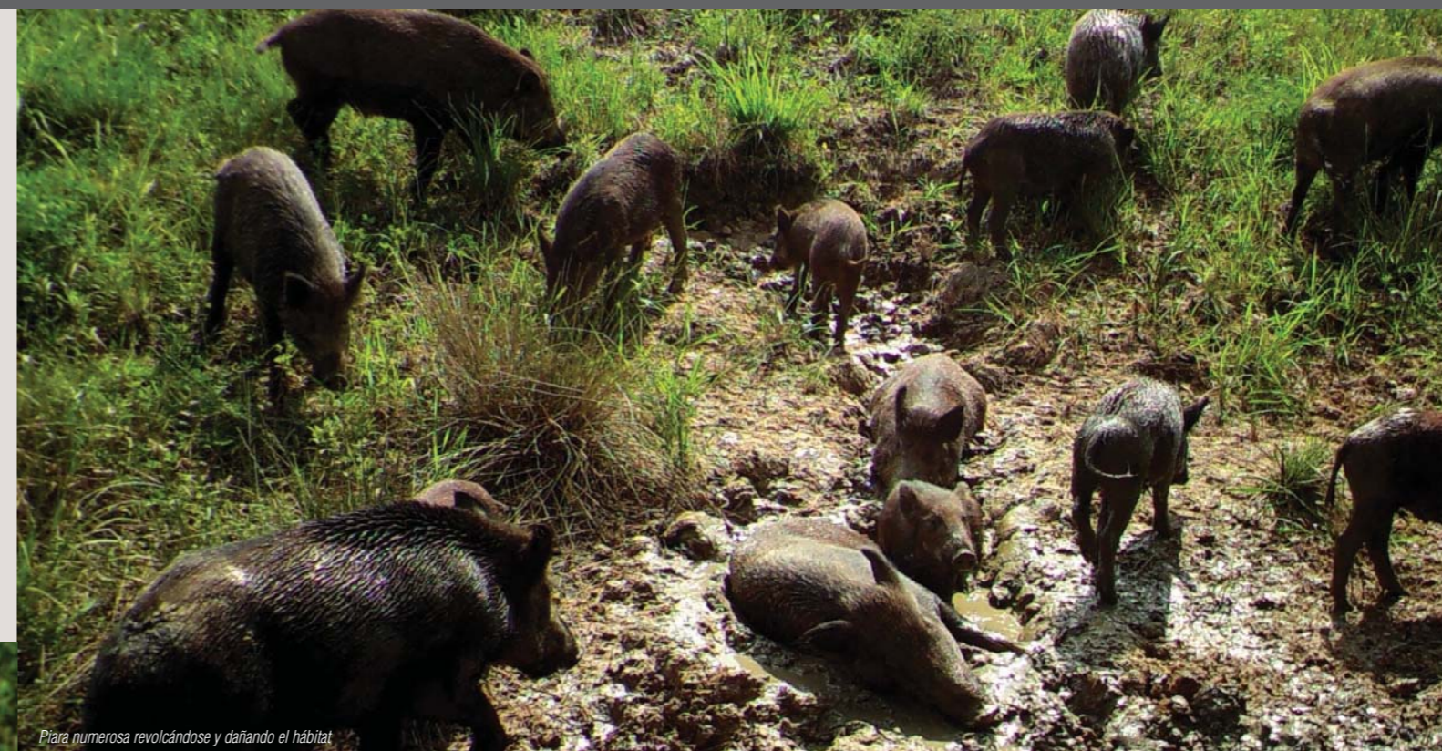
Piara numerosa revolcándose y dañando el hábitat