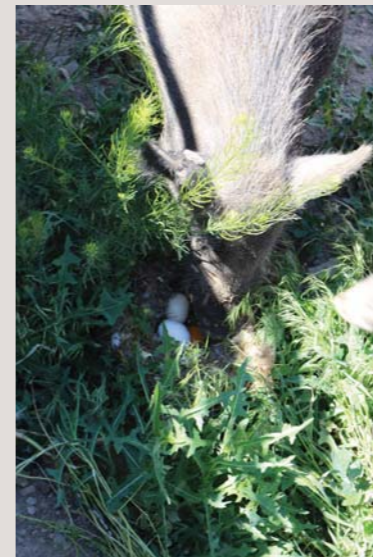
Cerdos asilvestrados comiendo los huevos de aves que anidan en el suelo

Los cerdos asilvestrados son ingenieros de ecosistemas, ya que pueden cambiar su entorno al influir en la vegetación y los suelos del área donde habitan, lo que a su vez modifica la distribución de las plantas en las praderas y los bosques, y destruye los hábitats de especies raras, como la libélula esmeralda de Hine. El hecho de que consuman