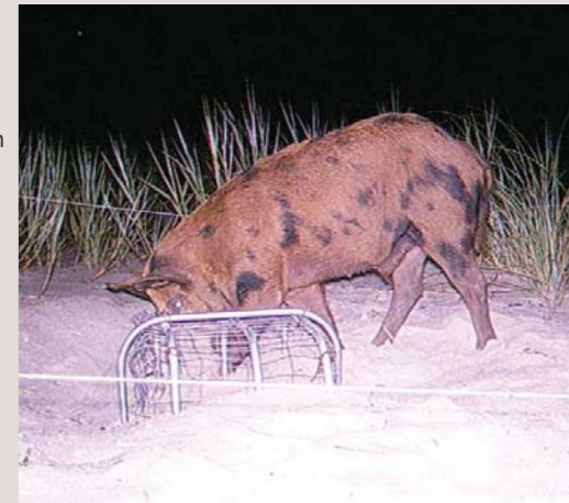
Cerdos asilvestrados escarbando los nidos de tortugas marinas protegidas para comer los huevos

Los cerdos asilvestrados comen principalmente vegetales. Sin embargo, estudios recientes han demostrado que también comen animales de la fauna local. Se sabe que los cerdos asilvestrados comen huevos de aves, reptiles y anfibios que anidan en el suelo, crías de mamíferos grandes, como los venados, y mamíferos, reptiles y anfibios pequeños, ya sean crías o adultos.